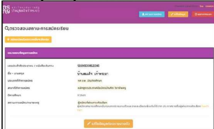
เลือกเมนูแก้ไขข้อมูลก่อนรายงานตัว