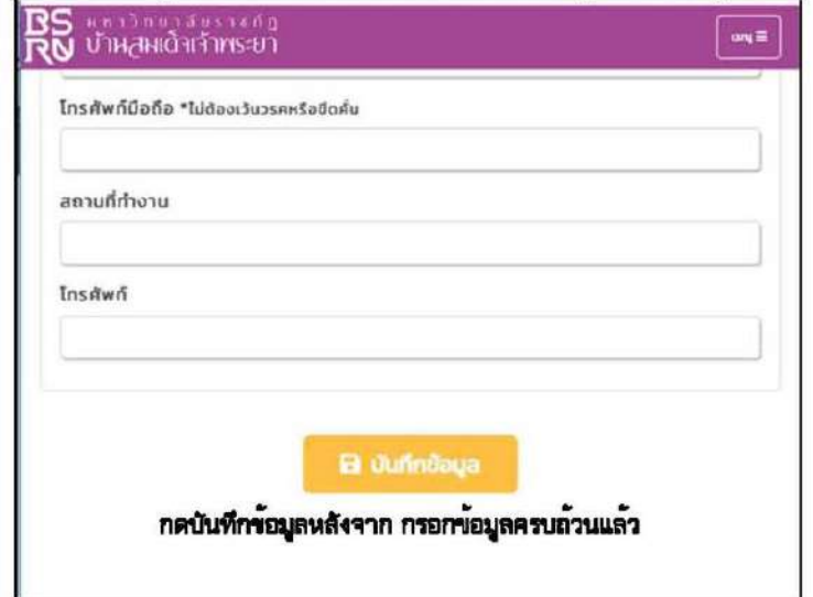
กดบันทึกข้อมูลหลังจาก กรอกข้อมูลครบถ้วนแล้ว