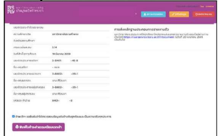
นำใบชำระค่าธรรมเนียมแรกเข้า มาแสดงกับเจ้าหน้าที่ในวันรายงานตัว